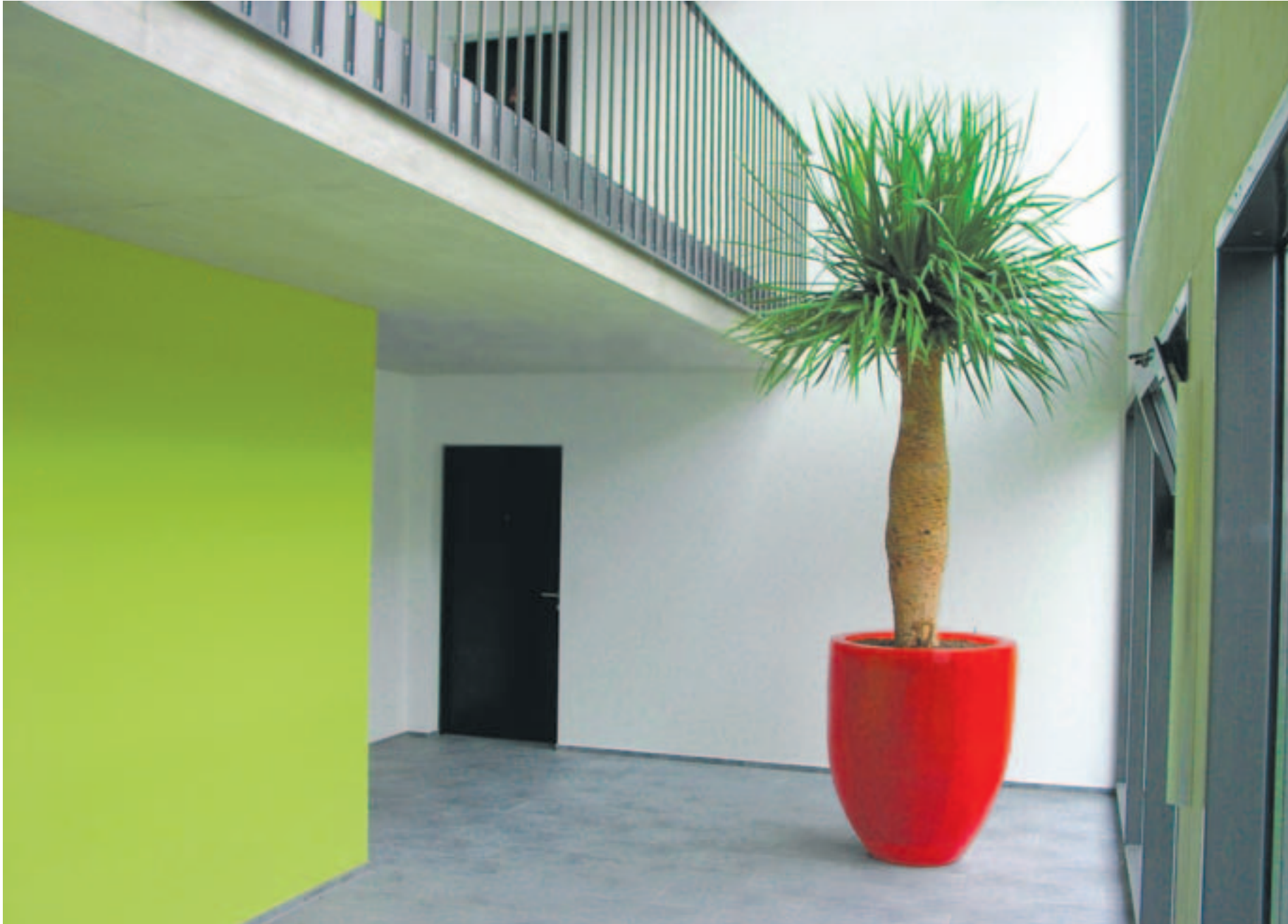
■ Dracaena draco in einem Fiberglasgefäss.